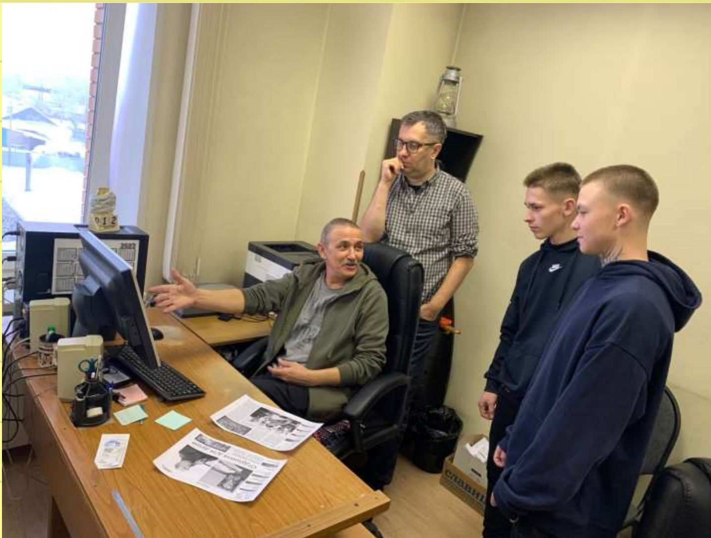
Редакция газеты «Канские ведомости»