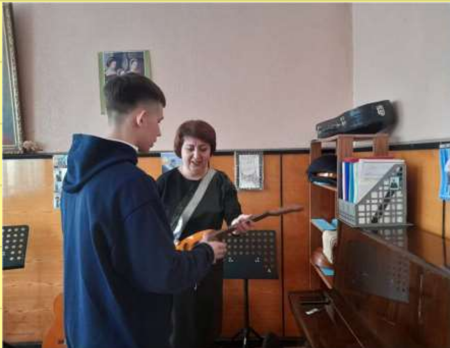
«Детская школа искусств № 1