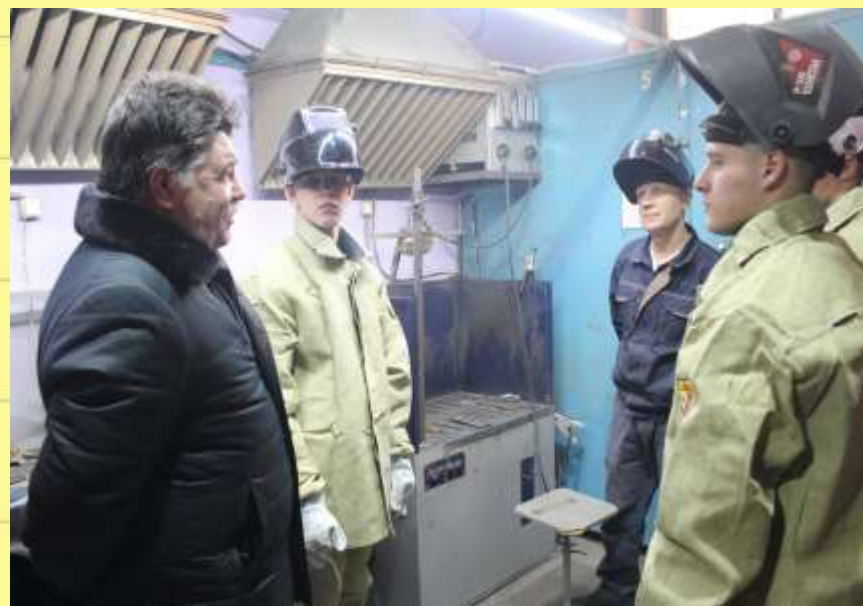
«Канский техникум отраслевых технологий и сельского хозяйства»