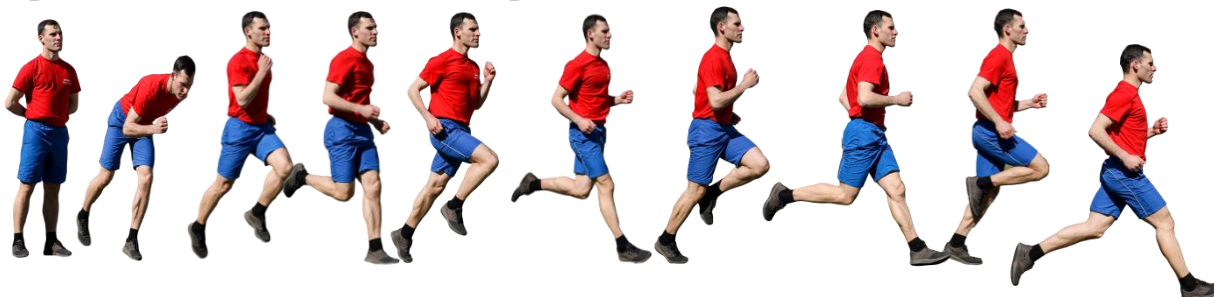
Рис. 7. Бег на 1 км, бег на 3 км.

Старт и финиш, как правило, оборудуются в одном месте. При выполнении упражнений на беговой дорожке стадиона старт и финиш производится в соответствии с разметкой стадиона.