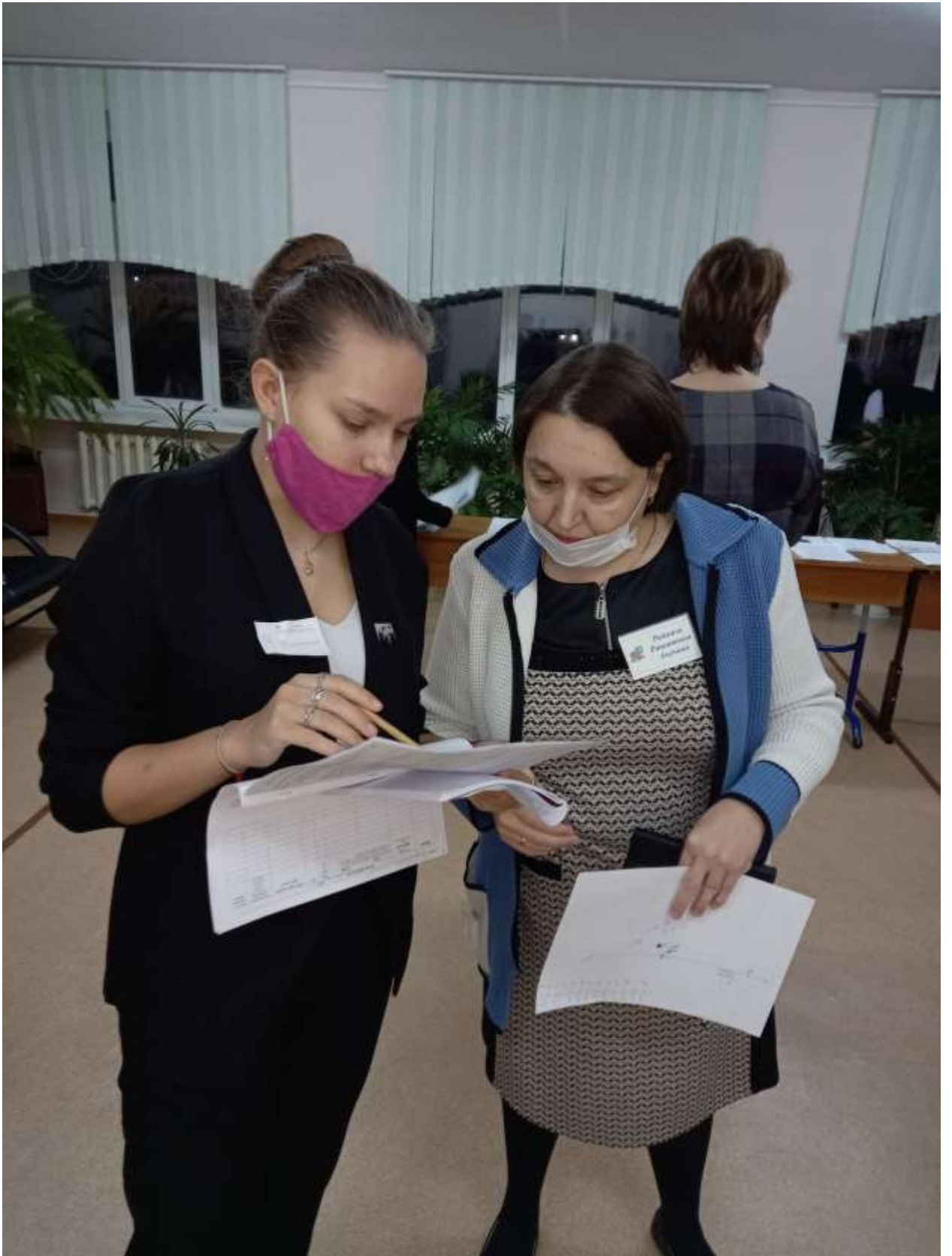
Утверждение индивидуальной образовательной программы с учительской кооперацией