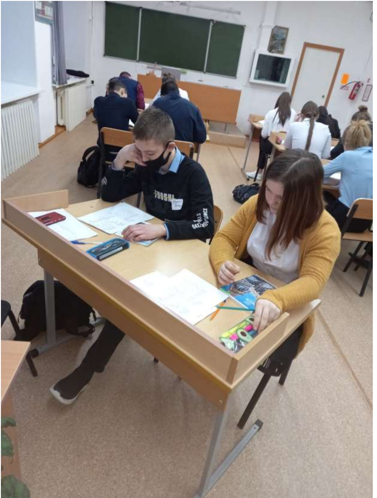
Работа в парах