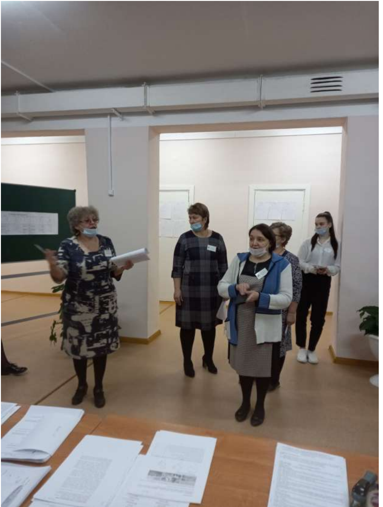
Открытие стажировочной площадки