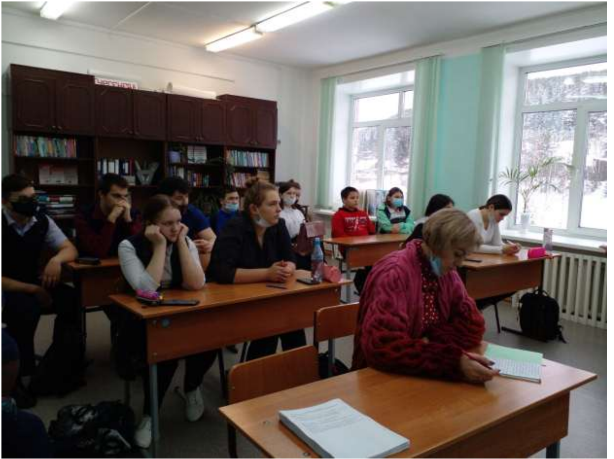
Открытие стажировочной площадки