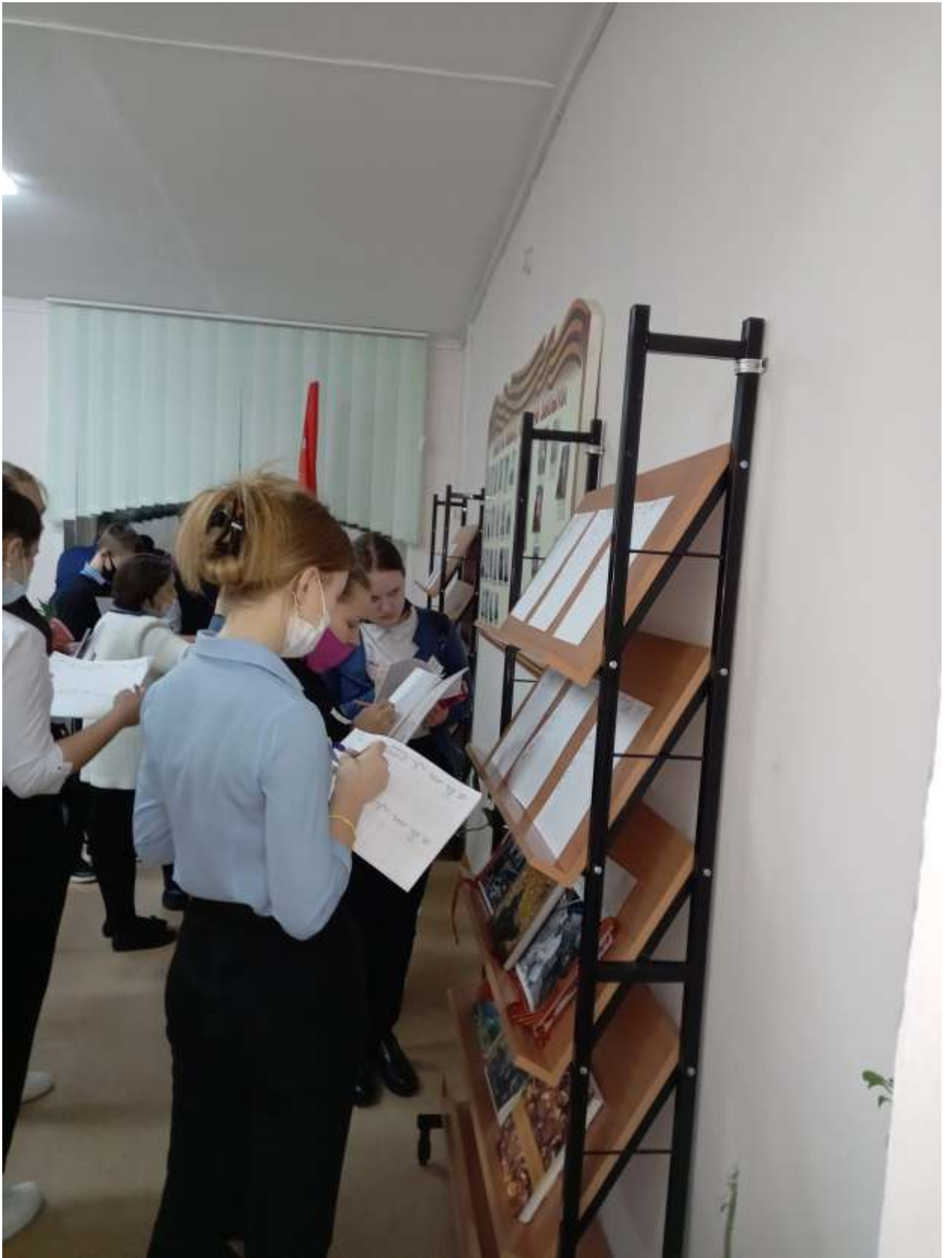
Реализация ИОП в разных временных кооперациях и индивидуально