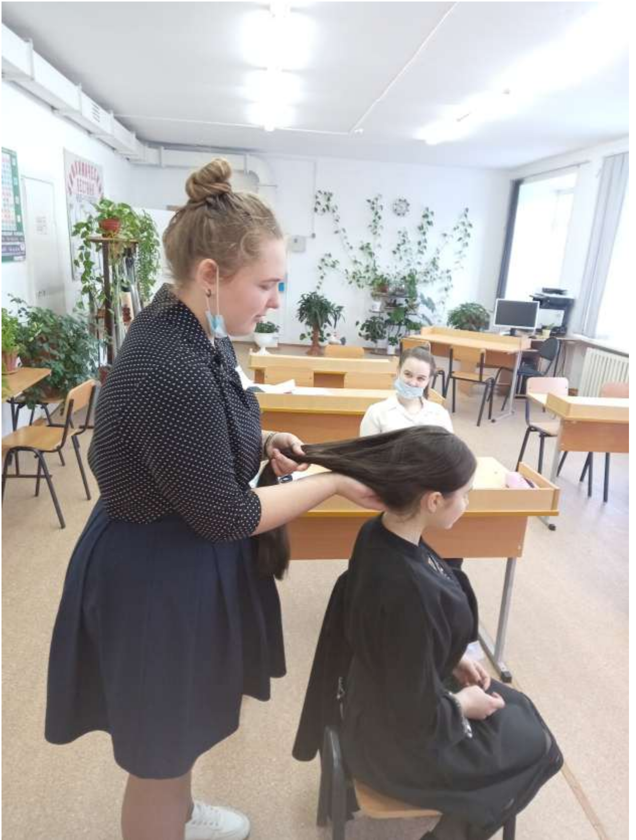
Клубная деятельность «Мастер-класс по плетению косичек»