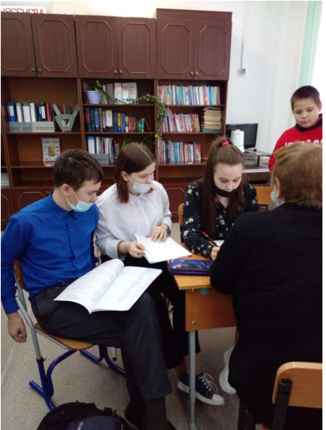
Согласование учебных программ в парах сменного состава